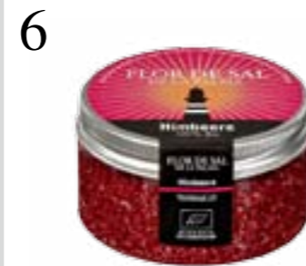
6 GOURMETSALZ Passt zu Fisch, Fleisch oder Fenchel-salat: Flor de Sal de La Palma, Himbeere. www.flordesal.ch , 70 g CHF 13.50