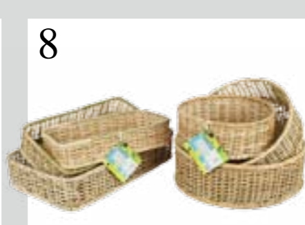
8 RATTAN RETTET REGENWALD Statt den Regenwald zu roden, werden im WWF-Rattanprojekt in Laos Körbe hergestellt. Bei Coop Bau + Hobby, ab CHF 9.90