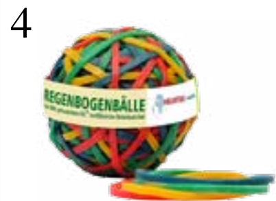
4 FÜR BÜROGUMMI Gummibänder-Ball aus FSC-zertifiziertem Naturkautschuk, gefertigt in einem Projekt in Sri Lanka. www.fairshop.helvetas.ch CHF 8.90