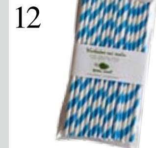
12 SCHLÜRF... Für grosse und kleine Kinder: Trinkhalme von Green Mood aus Papier, in sechs Farben. Bei Changemaker, 25er-Pack CHF 8.50