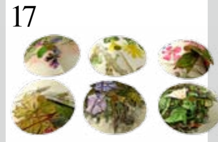
17 DAS IST MEIN WEIN! Verwechslung ausgeschlossen: Weinglas-Manschetten aus alten Büchern und Heften. www.markt-luecke.ch , 8 Stück CHF 8.50