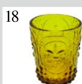
18 ROMANTISCHE SOMMERPARTY Das Trinkglas «Fiora» gibts aus gelbem, grünem und transparentem Glas, spülmaschinenfest und fair produziert. www.claro.ch CHF 9.50