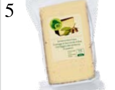
5 WÜRZIGES AROMA Gibt zusammen mit Birnenschnitzen ein perfektes Sandwich: Bio-Eichenrinden-Käse. In grösseren Migros-Filialen, 100 g CHF 2.60