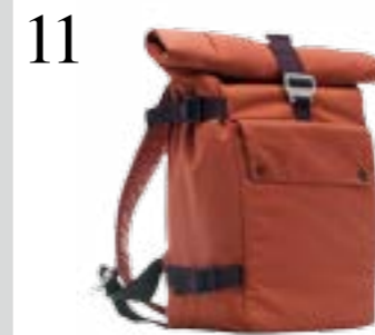
11 DER LAPTOP PASST AUCH REIN Der Rucksack «Bluelounge Eco-Friendly» ist aus recycelten PET-Flaschen hergestellt. Auch in Schwarz. www.rrevolve.ch CHF 169.-