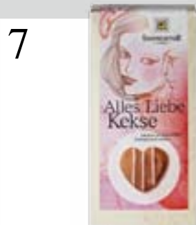
7 HERZIGES MITBRINGSEL Die «Alles Liebe Kekse» von Sonnentor aus Vollkorndinkel schmecken leicht nach Erdbeere. Müller Reformhaus, 125 g CHF 5.10