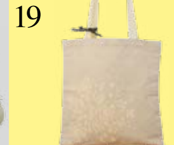
19 FUNDSTÜCKE MIT SWISSNESS

Traditionelles Schweizer Handwerk, gepaart mit modernem Design: Das ist die Idee hinter dem Online-Shop Matrouvaille. Die Produkte werden aus Holz, Papier, Leder oder Leinen in der Schweiz gefertigt. Da gibt es Tischsets mit einer herausklappbaren Blumenwiese, Holzpostkarten, Kofferetiketten mit Alpaufzug oder den Leinenbeutel für CHF 64.- (im Bild) mit einem aufgedruckten Ornament – so sieht herkömmliche Bauernmalerei zeitgemäss umgesetzt aus. www.matrouvaille.ch