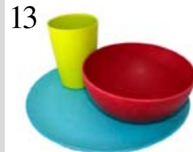
13 DRAUSSEN ESSEN Robustes Ökogeschirr «Rubytec Panda Bamboo», in drei Farben, spülmaschinenfest. Bei Transa, Sportxx oder Hajk, ab CHF 6.50