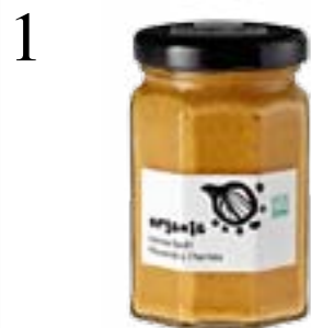
1 PEPPT DIE SAUCE AUF Harissa-Senf passt zu Siedfleisch, Würsten oder in eine pikante Salatsauce. Globus organic, 120 g CHF 4.90

Eistee oder Caffè-macchiato-Glace versüssen die heissen Sommertage. Bei garstigem Regenwetter trösten dafür Kräutertees und Dinkelguetsli in Herzchenform. Redaktion: Barbara Halter