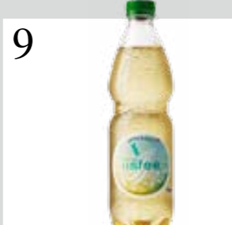
9 ZAUBERHAFTER ERFRISCHUNG Eistee lisfee von Flauder, Grüntee-Extrakt mit fruchtiger Note. Im Getränkehandel, www.mineralquelle.ch , ½ l ca. CHF 1.90