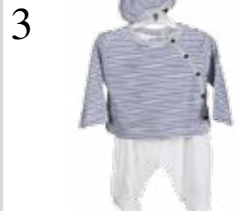
3 KLEINER MATROSE Baby-Set mit Mütze, Oberteil und Hose aus der Kollektion Mon Cœur von Manor. Aus 100 Prozent Bio-Baumwolle. CHF 29.90