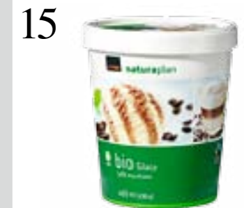
15 EISKALTE LATTE Für Kaffee ist es jetzt zu heiss, dafür gibts von Naturaplan das Bio-Glace Caffè macchiato, Fairtrade-zertifiziert. Coop, 460 ml CHF 5.20