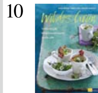
10 HEXENKÜCHE Wildpflanzen und -beeren lassen sich auch in der Küche verwerten. Das Kochbuch «Wildes Grün» zeigt wie. AT Verlag CHF 32.90