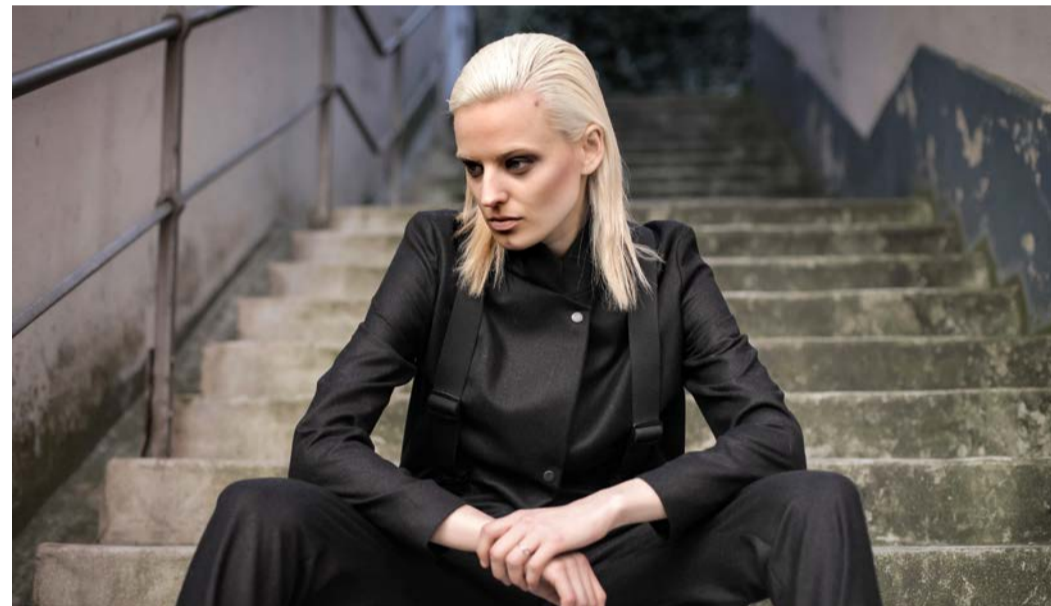
Mode: Zwischen klassischer Eleganz und modernem Street-Style. Schal, Jacke und Hose, anthrazit, aus feinsten Wolle. velvet novel, Luzern (45/490/320 Fr.)