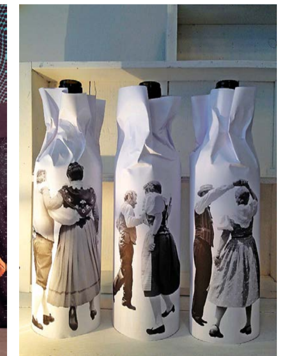
Verpackung: Papierhülle für Wein oder selbst gemachten Sirup. matrouvaile, Luzern (Dreier set 19 Franken).