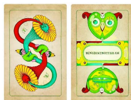
Verspielte Jasskarten: nah am Original, fantasievoll und witzig gestaltet, von Benedikt Nottter, Luzern (15 Franken).