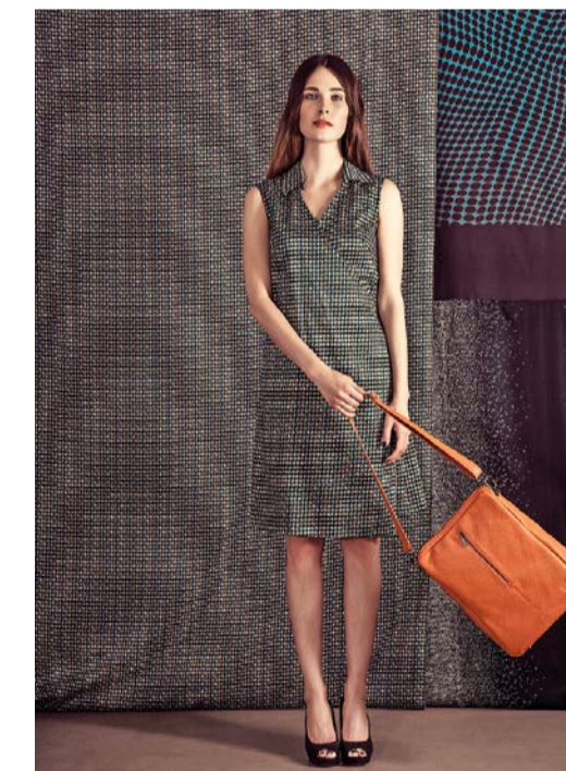
Tasche: Modell «Facile», Leder, aus der Sommerkollektion 2015, von Kleinbasel, Basel (459 Franken).