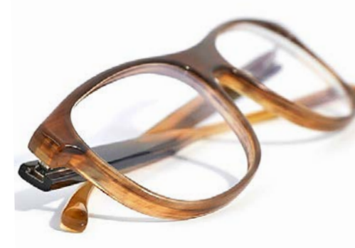
Büffelhornbrille: Leicht, hautfreundlich, individuell im Farbton, nicht aus Tierzucht. Götti+Niederer, Luzern (ab 1080 Franken).