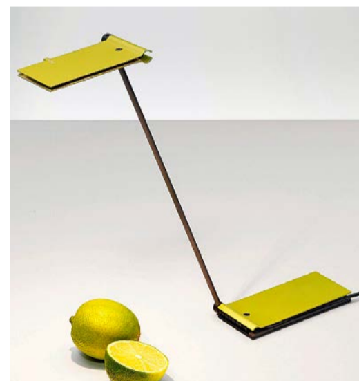
Leselampe: Modell «Zett», Lemon, mit USB-Anschluss, von Baltensweiler AG, Luzern (330 Franken, exkl. MWST).