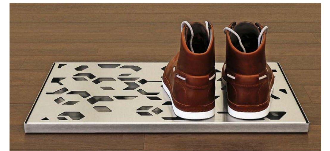
Schuhablage: Edelstahl geschliffen, 52 x 34 x 2 cm. Neustahl, Luzern (240 Franken).