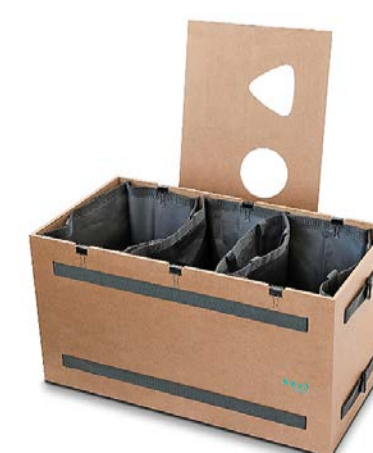
Trennen, sammeln, entsorgen: Boxen aus Materialien und Grössen, teils wetterfest, Separo, Baar (ab 120 Franken).