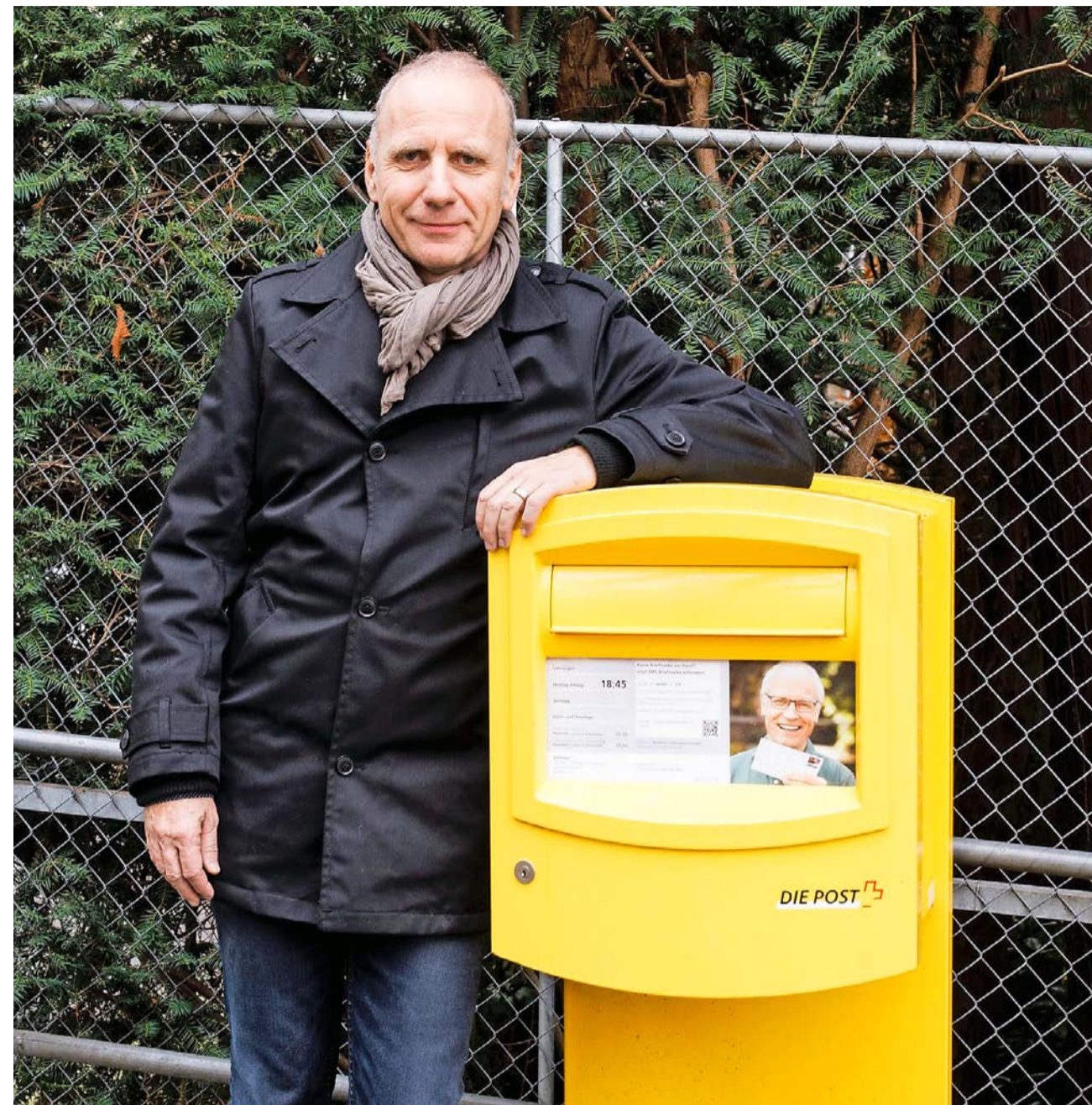
Der goldgelbe Briefkasten der Schweizer Post, designt in Luzern: Peter Wirz von Vetica.

Der nette, strahlend gelbe Briefkasten ist durch und durch «swiss made». Genauso wie die Badezimmermöbel, welche Vetica für die Hochdorfer Firma Talsee entwarf. Die beiden Unternehmen wirken dieses Jahr bei «Design Schenken» als Duo mit. In den Räumlichkeiten von Vetica an der Weggisgasse 40 werden drei Badmöbel-Installationen zu betrachten sein. Daneben bieten die Tage der offenen Tür Einblick in den Agenturalltag. Peter Wirz, ehe-