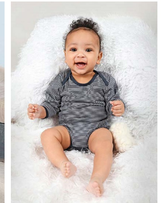
Mode: Baby-Body aus 100% neuseeländischer Merinowolle. Boo. Merino, St. Erhard (35 Franken).