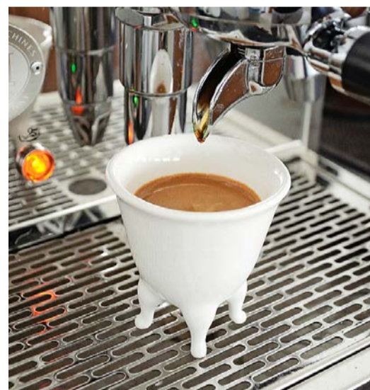
Espressomaschine: Modell «Vittoria», 3D-gedruckt aus Porzellan, hergestellt vom Inuk Kollektiv, Luzern (42 Franken).