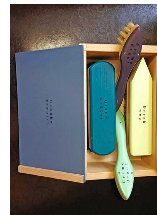
Schuhputzset: 4 Bürsten in Holzkiste, Blindenfürsorgeverein Innerschweiz und EigenmannDurot, Zürich (99 Franken).